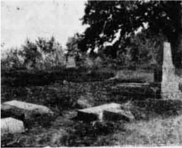
Porušeno i spaljeno srpsko groblje (Begov Lukavac kod Istoka)

povređivani srpski grobovi u selima Buzovik, Petrič, Velika Hoča, Žegra, Robovac, Smoluša, Straša, Koriša, kao i to da su crkve srpske provaljivane, pljačkane i sknavljene u: Gornjem i Donjem Nerodimlju, Babljaku, Štimlju, Dobrčanu, Prizrenu (Sv. Nikola), Donjoj Gušterici, Vrbovcu, Žitinju, Cernici, Kosovskoj Kamenici, Donjem Drenovcu, Straži, Dobrotinu, manastiru Sokolici i drugim srpskim naseljima, onda postaje jasno kako su se Srbi tada osećali, posle takvih varvarskih bestijanja i izivljavanja arbanaških siledžija i zulumčara nad srpskim življem i njegovim svetinjama.