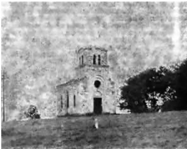
Poluporušena (od Šiptara tokom rata) crkva u Bistražinu kod Đakovice

Kao primer raznovrsnih arbanaških pritisaka i zlodela činjenih Srbima, navešćemo samo jednu žalbu episkopa prizrenskog Pavla upućenu Verskoj komisiji AP Kosova: "Ne jednom smo se do sada obraćali Vama za zaštitu zakonitosti za Pravoslavnu crkvu i njene vernike i imovinu... (zatim navodi slučajeve obijanja crkava u selima Vinarcu i Dobračinu i u Prizrenu - A. J.) ... U groblju sela Šipolja kod Kosovske Mitrovice, tokom leta ove 1972. g. mladići albanske narodnosti, pevajući uvredljive pesme protiv Srba, porušili su 15 nadgrobnih spomenika. Slično rušenje spomenika desilo se nedavno i u selu Srbovcu kod Kos. Mitrovice, gde je porušeno 8 spomenika. Tako je i na groblju u Orahovcu, gde su polomljeni ne samo drveni nadgrobnikrstovi, nego i 7 spomenika od mermera, 2 od cementa i 14 kamenih krstova. U selu Opteruši kod Orahovca, polomljena su 3 nadgrobnikamena krsta i svi drveni krstovi sem tri. U selu Retimlju kod Orahovca polomljeni su na groblju ovi drveni krstovi i na grobovima je vršena velika nužda."[31]