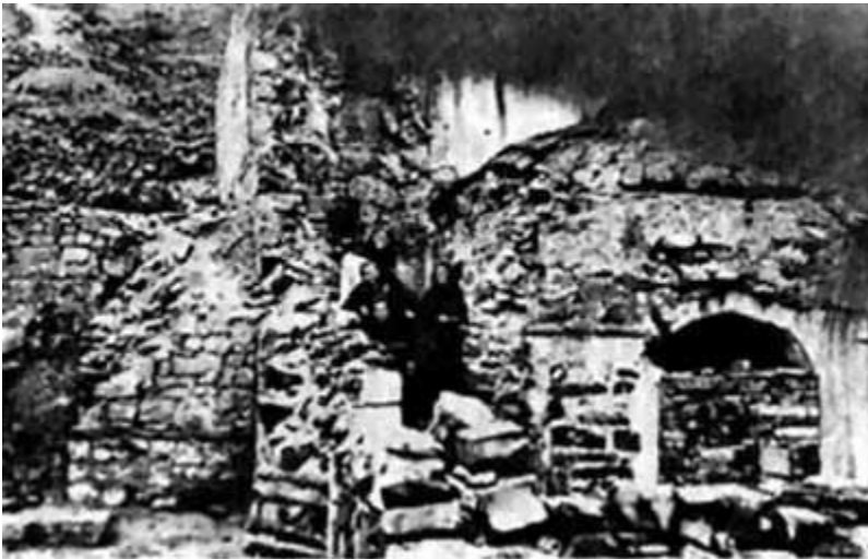
Manastir Devič srušen oktobra 1941. g. (snimak iz 1947.)