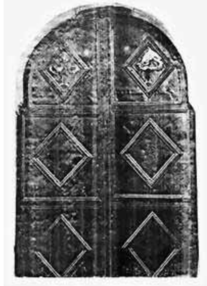
Vrata Saborne crkve u Prizrenu: krstovi namazani ljudskim izmetom od obesnih Šiptaromuslimana

- Dvadeset sedmog oktobra 1988. oko pola devet uveče unutar ograde fabrike "Braća Karić" u Peći nepoznato lice ispalilo je nekoliko hitaca iz vatrenog oružja. Posle toga neko nepoznat telefonirao je portiru ove fabrike i provocirao ga i vređao. Opšte je mišljenje u Peći da je ovo smišljen napad na srpsku fabriku, kojim šiptarski šovinisti i separatisti žele da unesu strah i uznemirenje među srpski živalj. Poznato je inače da radne organizacije Braće Karić iz Peći dosta pomažu nezaposleni srpski živalj i zato su često na meti šiptarskih fašista na Kosmetu.