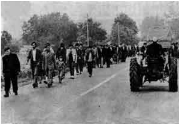
Srbi iz Batusa, Kline i Kosova Polja krenuli na kolektivno iseljavanje zbog šiptarsko-komunističkih nasilja i nepravdi (20. juna 1986).