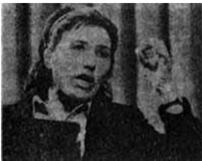
Srpska majka s Kosova protestuje u Skupštini u Beogradu

Prvo, zašto se niste obratile Predsedništvu SFRJ, drugim rukovodiocima i saveznim organima za čuvanje ljudskih prava povodom naše dugogodišnje izolacije, upravo zbog zatočeništva i progona Srba i Crnogoraca s Kosova, o njihovim patnjama, proterivanju iz zavičaja itd.?