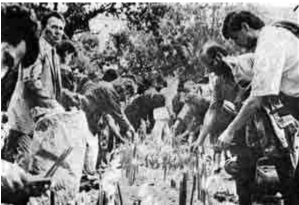
Paljenje sveća Kosovskim žrtvama u Gračanici (600-ti Vidovdan 1989.)

- U ponedeljak 19. juna 1989. pred 600-ti Vidovdan, stigle su na Kosovo Svete Mošti Sv. Velikomučenika Kosovskog Kneza Lazara. Dopratio ih je vladika, sveštenstvo, monaštvo i narod Žičke eparhije, a vladika, sveštenstvo, monaštvo i narod Kosovski dočekali su ih na granici Kosova i sa njima išli najpre na polje bitke, Gazimestan, gde je otslužen opšti pomen svim Kosovskim Žrtvama i opevani tropari Sv. Velikomučeniku Lazaru i Kosovskim Mučenicima i Novomučenicima, a odatle su Svete Mošti prenete u manastir Gračanicu, gde su ih dočekali na desetine hiljada Kosovsko-metohijskih Srba. Bilo je potresno videti suze u očima Episkopa Raško-prizrenskog i Kosovo-metohijskog Pavla, koji je ispred mučeničkog Srpskog Kosovskog naroda pozdravio Čestitoga Kneza i podneo mu tužni raport o stanju Srba i Srpskih svetinja na Kosovu. Sveti Velikomučenik Knez Lazar došao je na Kosovo da izvrši duhovnu i narodnu smotru i da mu se Srpski napaćeni narod pokloni i time potvrdi svoju vernost i odanost svetom zavetu i opredeljenju Kosovskom za Carstvo Nebesko i Pravdu Božiju. (Slovo ovoga hroničara videti na kraju knjige, Prilog 4).