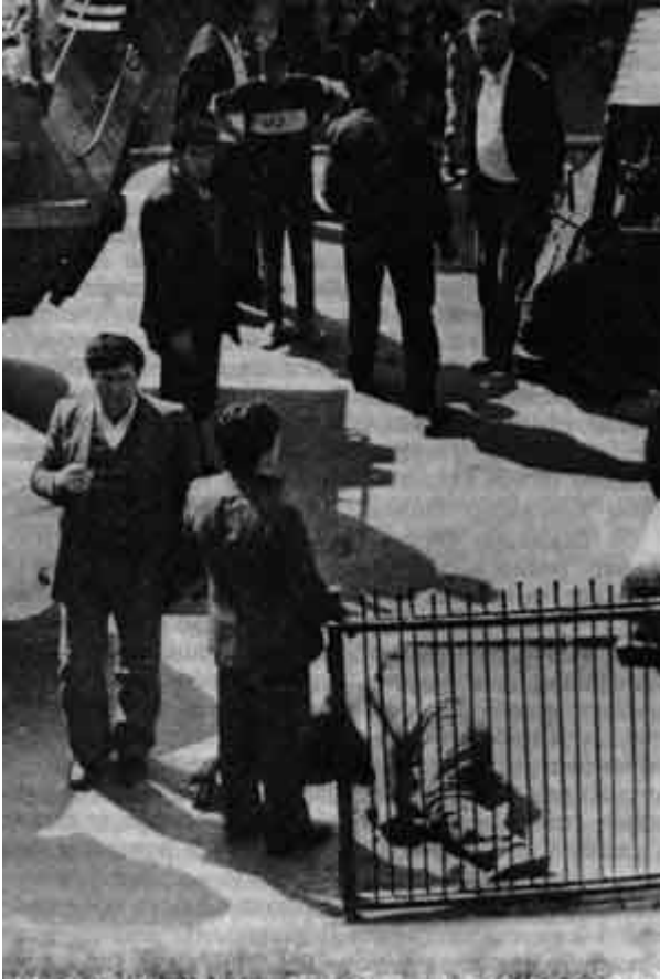
Srbin na zemlji pretučen (Podujevo, 22. marta 1990).