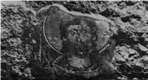
Oštećena od Šiptara freska (XIV vek) jednog Svetitelja u Sv. Petru Koriškom kod Prizrena

Valjda će ovo najnovije stradanje Srpskog Kosovskog naroda konačno otvoriti oči svima u ovoj zemlji, ako nam je stalo do zajedničke budućnosti i naročito do budućnosti naše dece.