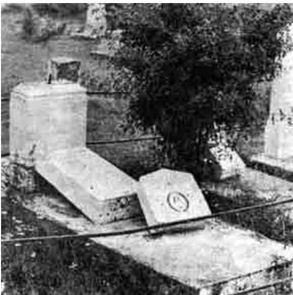
Srušeno i oskrnavljeno od Šiptara srpsko groblje u Srbici

Šiptari, koji su se koliko do juče slepo držali kompartije i njenog totalitarizma, i kao svog najvećeg pokrovitelja Broza Tita, Hodže i Šuvara, odjednom su iskoristili raspad komunističke monolitnosti za svoje separatističke ciljeve (otcepljenje Kosova od Srbije i Jugoslavije), u čemu su sada našli potpuno saglasne i komuniste Slovenije i Hrvatske. Šiptarske demonstracije odmah su postale demonostracije, a pozivanje u parolama na "demokratiju" pretvorilo se ubrzo u "horor demokratiju" ili u demonokratiju. Sledeći zapisi ove crne hronike, koju sam delimično vodio i na samom Kosovu tih dana, dovoljno svedoče o tome.